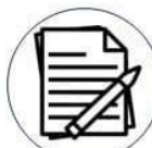
สมุดยึดทรัพย์สินของกลาง