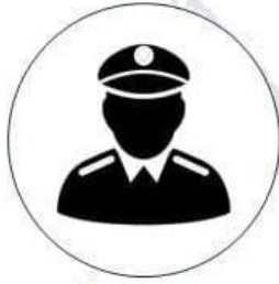
พนักงานสอบสวน