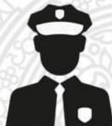
หัวหน้าสถานีตำรวจ